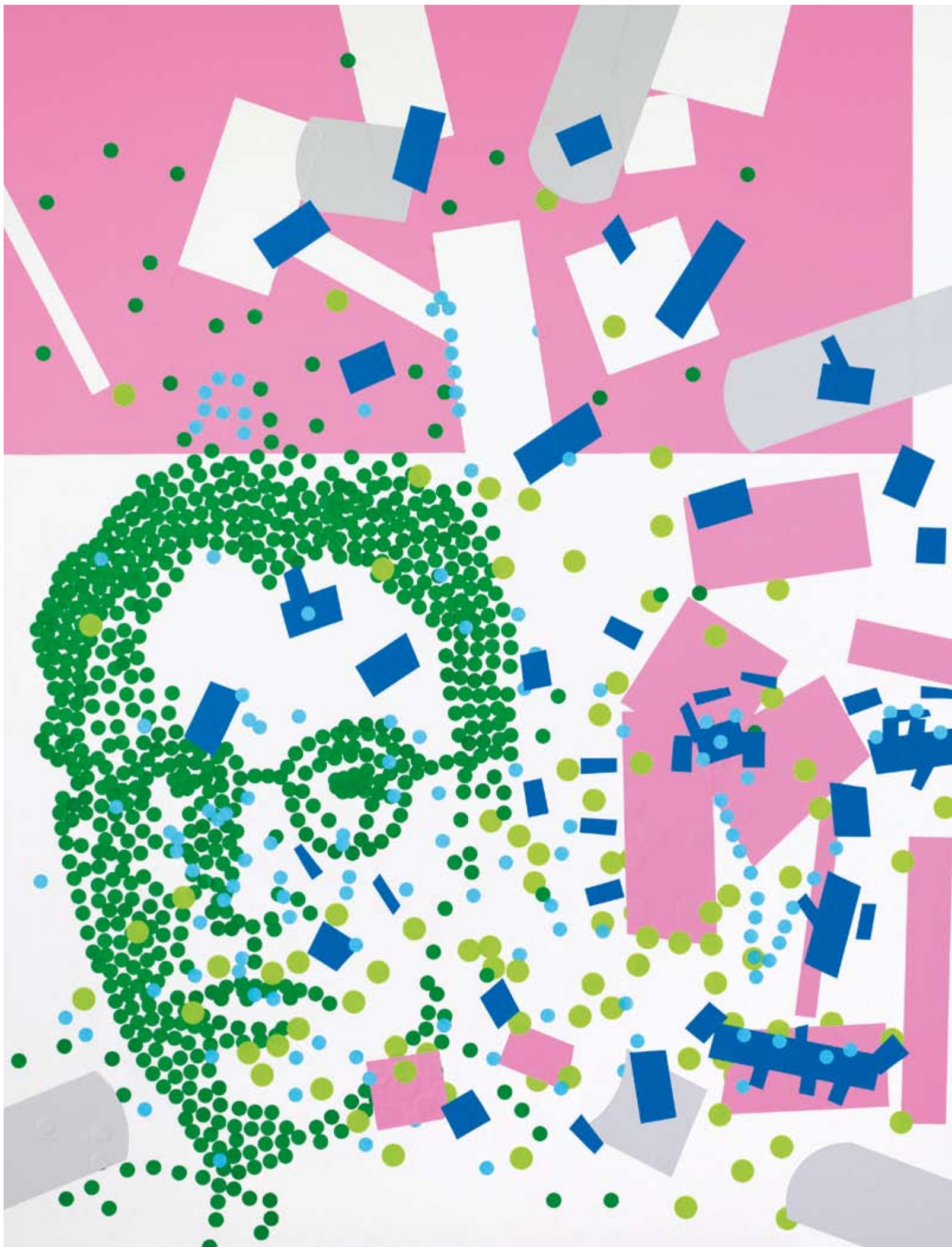
MALINA von Ingeborg Bachmann — Improvisation #8, Adrian Bättig