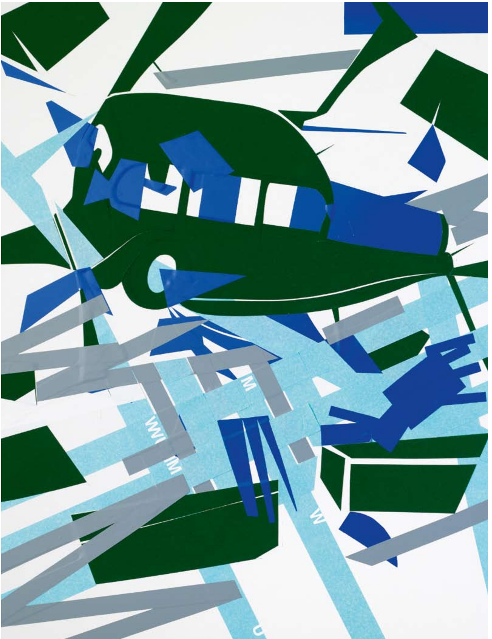
BERLIN ALEXANDERPLATZ von Alfred Döblin — Improvisation #4, Adrian Bättig