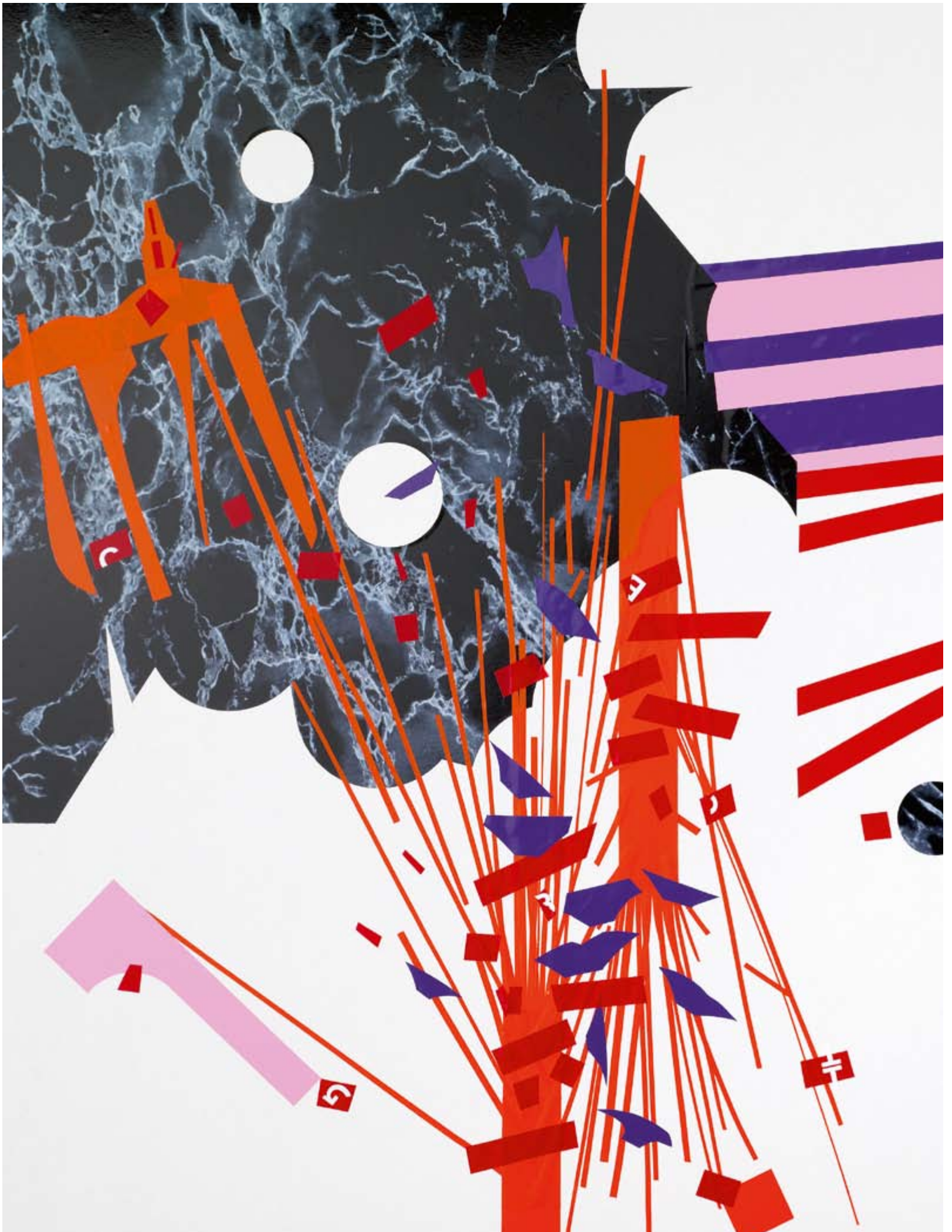
DER RICHTER UND SEIN HENKER von Friedrich Dürrenmatt — Improvisation #9, Adrian Bättig